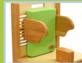
Rückenkissen mit waschbarem Bezug