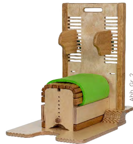
Abb. Gr. 2