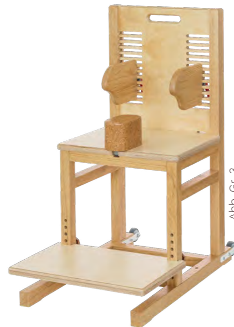
Abb. Gr. 3

Die Rumpfhaltung kann durch einen kontrollierten Rückbau der Hilfen weiter trainiert werden und fördert so den Muskelaufbau.