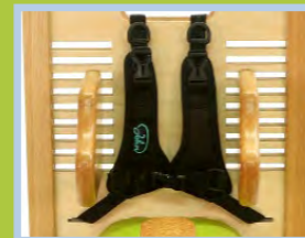
Positionierungshilfen z.B. 4-Punkt-Brustgurt, Beckengurt, Sitzhose, u.v.a.