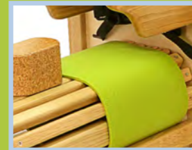
Antirutschmatte für BEN/LEO Gr. 2-4 orange bordeaux blau lila grün grau schwarz