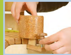
Abnehmbarer Sitzkeil für LEO Gr. 2-4