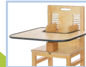
Tisch für BEN/LEO Gr. 2-4