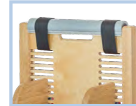
Nackenpolster mit 2 Klettverschlüssen Gr. 2-4