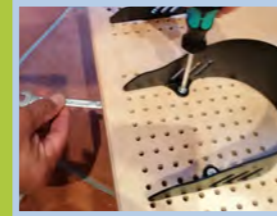
Fußschalen für BEN mit Klettband