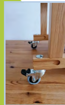
4 Rollen auf Kufen montiert

Das komplette Zubehör zu allen Modellen und Größen finden Sie jeweils unter www.kreativholz.de