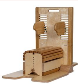
Abb. Gr. 2